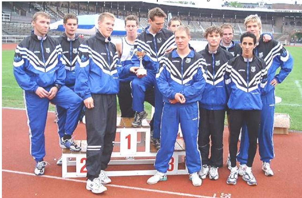
Segerlaget vid Dagbladsstafetten 2000